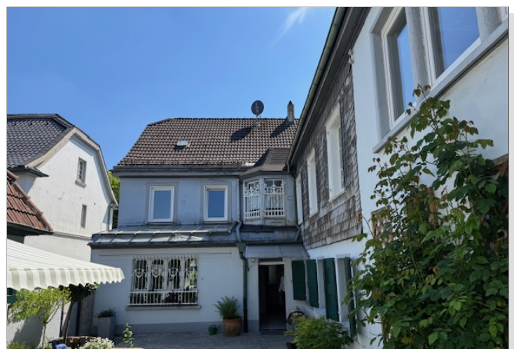
Garten mit Rückansicht