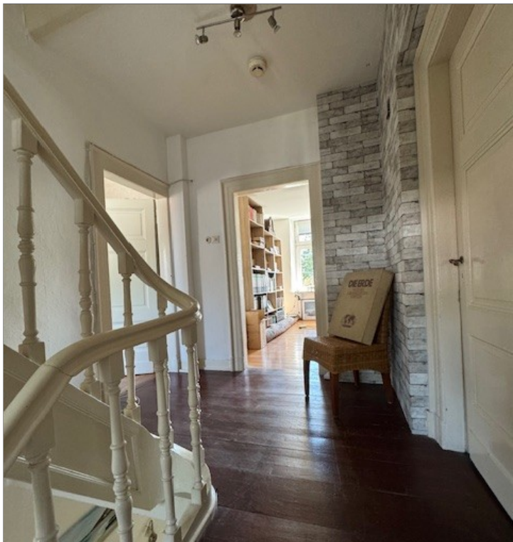
Diele OG Haupthaus