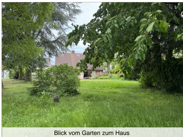
Blick vom Garten zum Haus