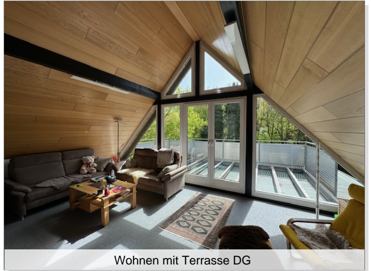
Wohnen mit Terrasse DG