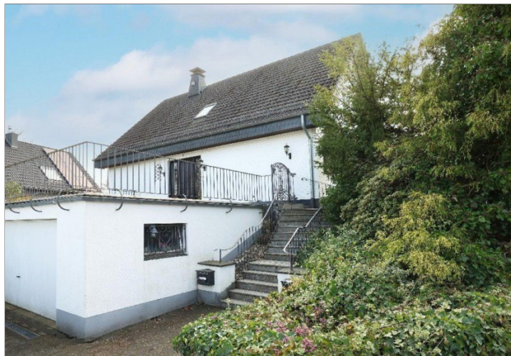
Ansicht vorne mit Garagen