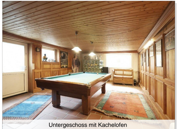
Untergeschoss mit Kachelofen