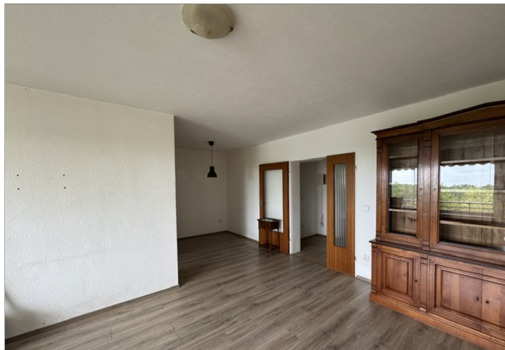
Wohnraum mit Essecke