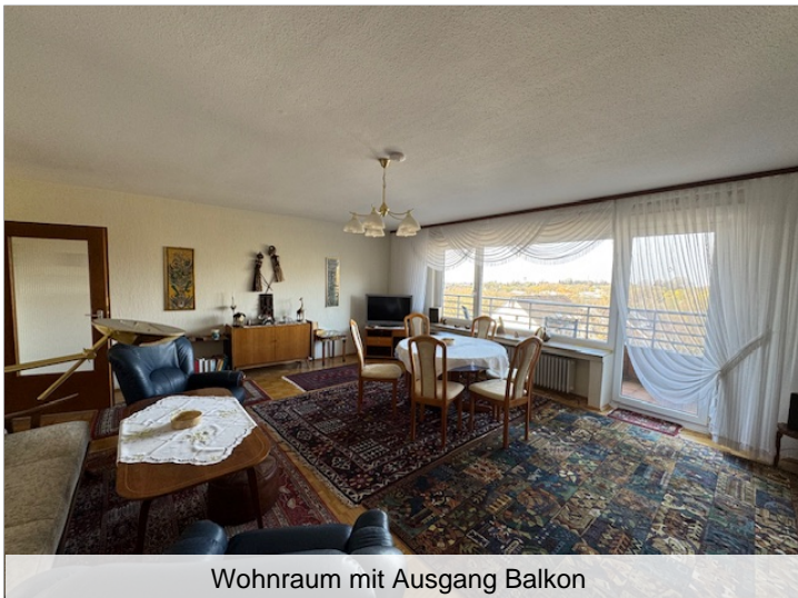
Wohnraum mit Ausgang Balkon