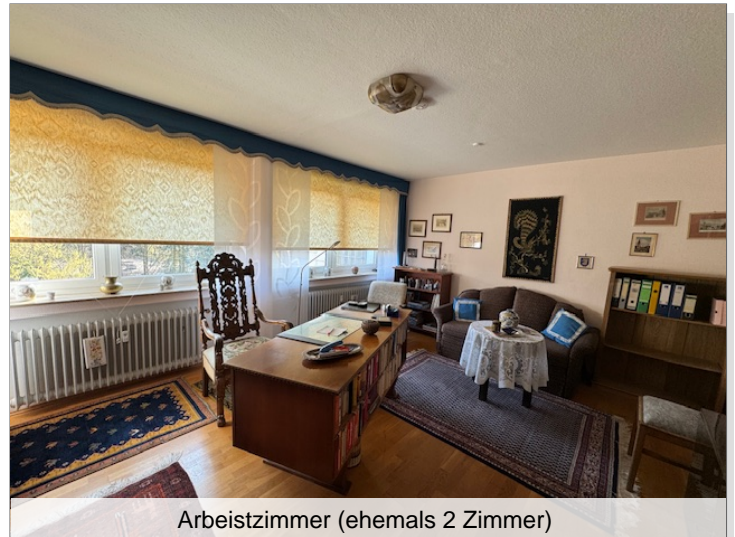
Arbeitszimmer (ehemals 2 Zimmer)