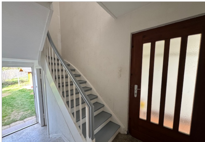
Treppenhaus mit Ausgang zum Garten