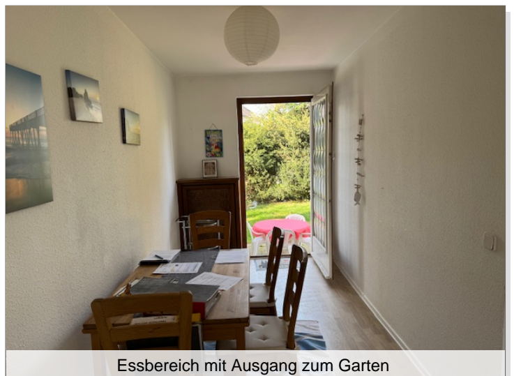
Essbereich mit Ausgang zum Garten