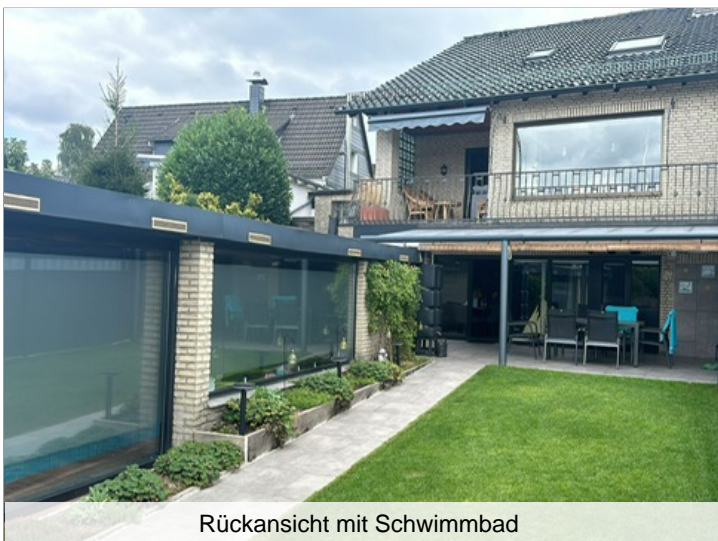
Rückansicht mit Schwimmbad