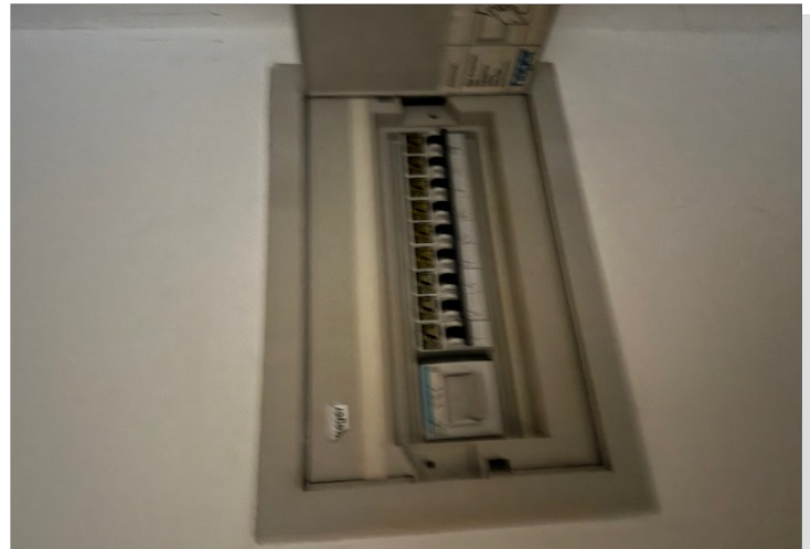
Sicherungen in der Wohnung