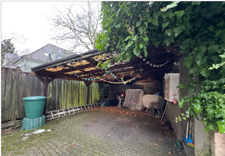
Carport daneben Werkstatt