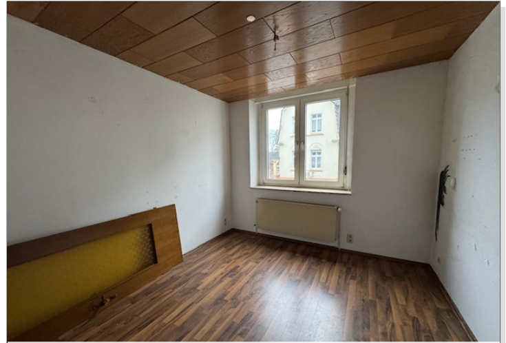
Wohnraum Appartement EG