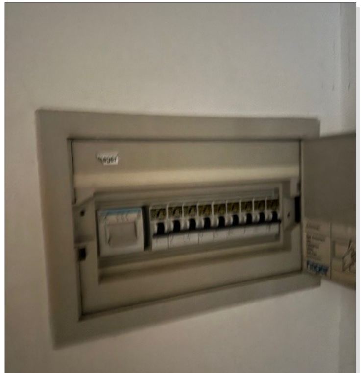
Sicherungen in der Wohnung