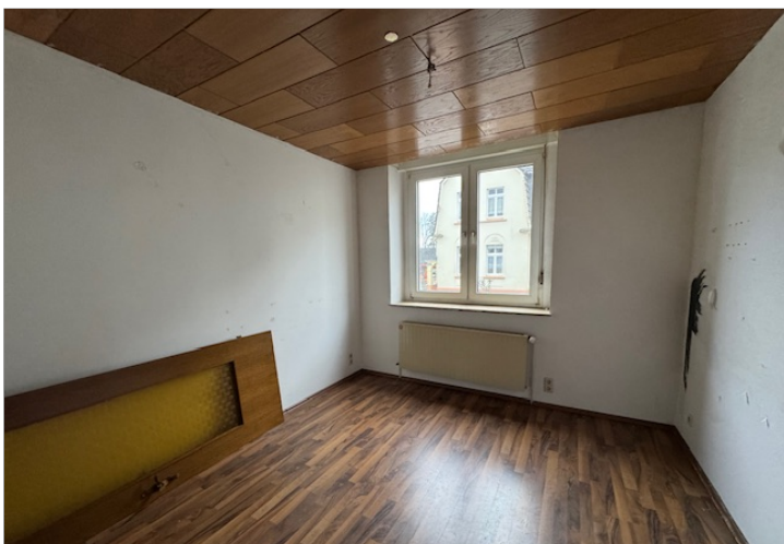
Wohnraum Appartement EG